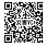
申込フォームQRコード