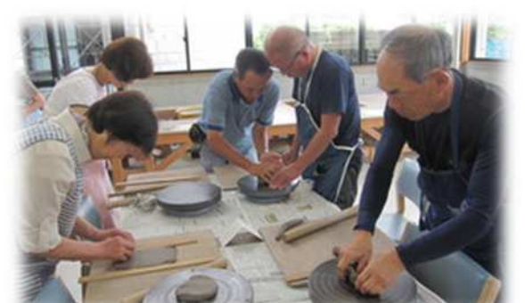
くにびき学園の運営