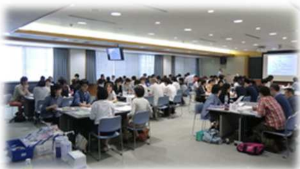
福祉人材センター事業（各種研修会等の開催等）