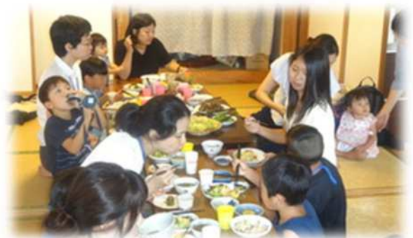
地域が一体となった子育て・子育て支援（子ども食堂等）