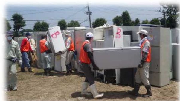
災害発生時における被災者支援活動